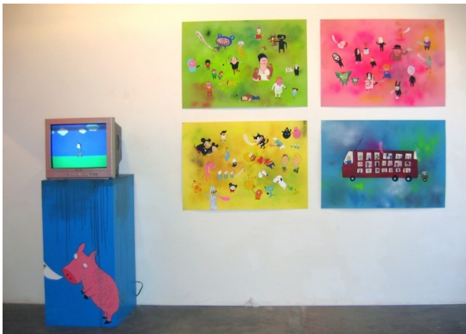
"RO(T)FL" alla Freight+Volume di New York