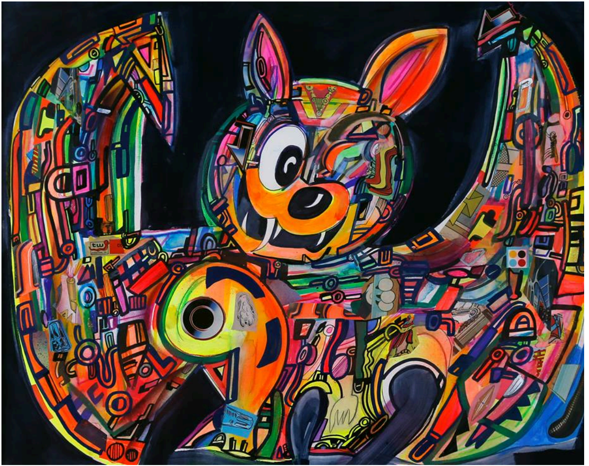
UNTITLED, 2011/collage on paper, 47 x 60